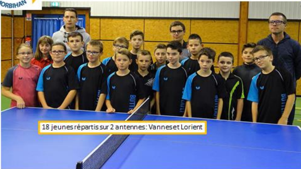
18 jeunes répartis sur 2 antennes: Vannes et Lorient